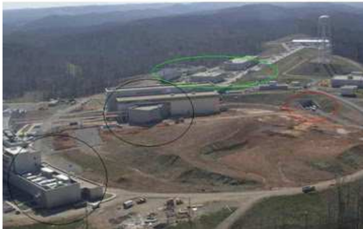
Foto 3 zeigt die ROWS ( Remote Operational Weapons System, Operatives Remote Waffen System ) Hardware in Oak Ridge.

Dies ist ein wärmesuchendes mechanisches Gewehrssystem, das sich automatisch auf alles richtet, was sich in seiner sensorischen Reichweite befindet. Es feuert auf Kommando der Wächter im Untergrund